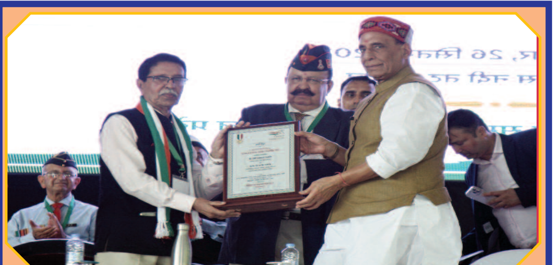
The Union Minister for Defence, Shri Rajnath Singh felicitating the families of the heroes of the Armed Forces, who laid down their lives in the service of the nation, at an event in Badoli, Himachal Pradesh on September 26, 2022

cials and asked them to develop a district skill development plan that maps local aspirations and creates opportunities for jobs and entrepreneurship. "Our emphasis should be making optimum use of local resources and reduce migration to urban centres," he said. The Minister also reviewed the implementation of Central government schemes and urged the functionaries to work zealously until the last mile is covered, every voice is heard.